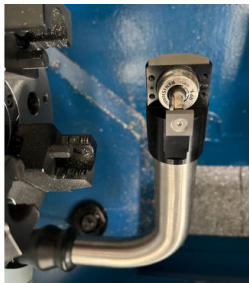
HPRA mit RP3 Messtaster