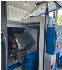
Separate Ständereinheit für sichere Lagerung des HPRA