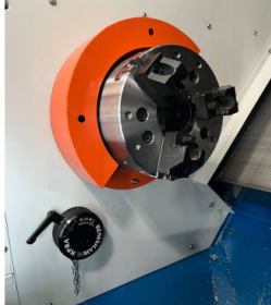
Schnellspanneinrichtung im Arbeitsraum