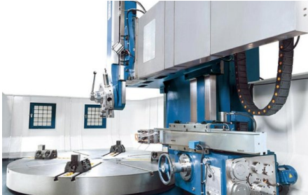
Vertikaler Support mit 5-fach Werkzeughalter und Seitensupport mit eigenem Vorschub für Innen- und Außenbearbeitung