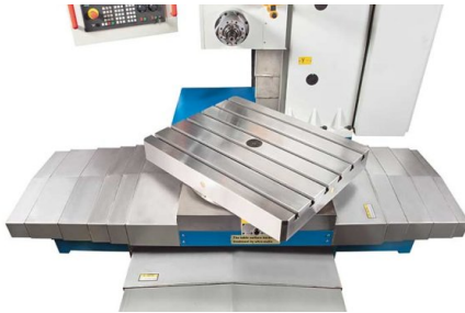
360° drehbarer Arbeitstisch