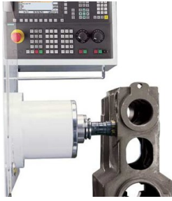
Mehrseitenbearbeitung in einer Ausspannung