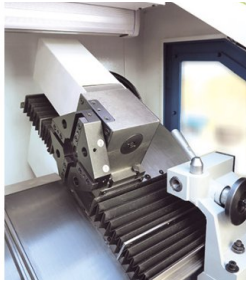
4-fach Werkzeugrevolver und Reitstock