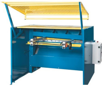
Schwenkbare Arbeitsraumabdeckung für die Sicherheit des Bedieners