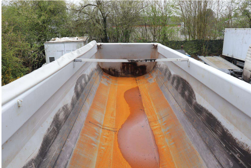
Bild 13 Einsatzbedingte Abschürfungen in der Mulde