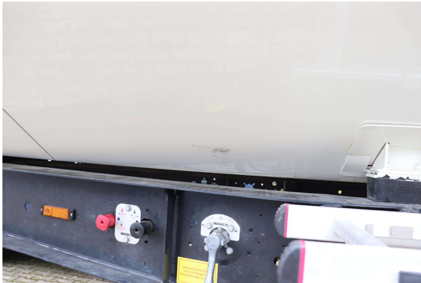
Bild 9 Leichte Lackkratzer auf der Seitenwand links