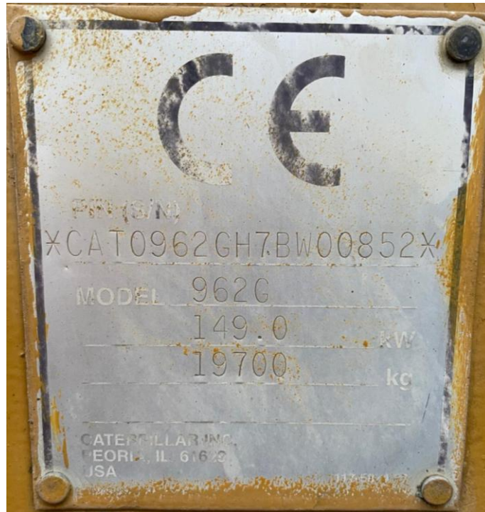
Photo VIII Marquage CE 962 G- CE-Kennzeichnung 962 G- CE marking 962 G