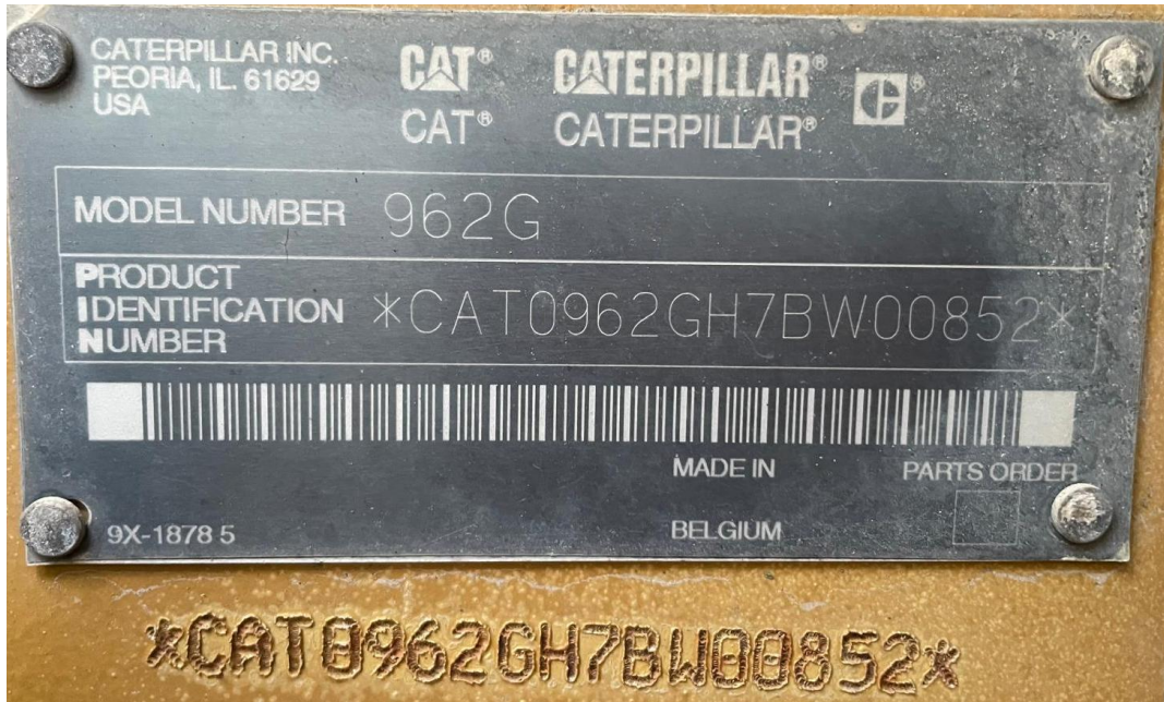
Photo X Plaque signalétique 962 G- Nameplate 962 G- Typenschild 962 G