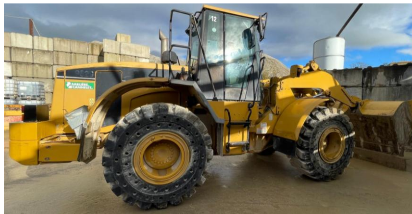
Photo VII Autre vue- Another view- Andere Ansicht