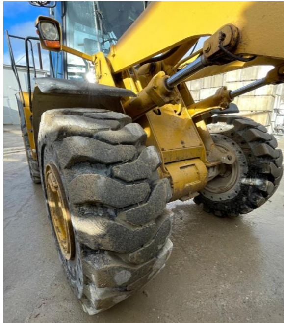
Photo IV Essieu avant et pneus increvables-Front axle and puncture-proof tyres- Vorderachse und pannensichere Reifen