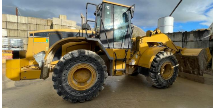
Photo I Vue latérale-side view-Seitenansicht