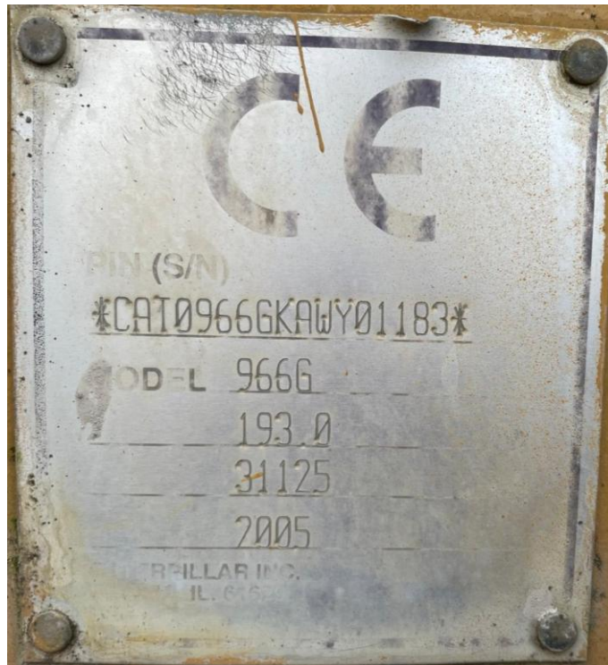
Photo IX Marquage CE 966 G- CE-Kennzeichnung 966 G- CE marking 966 G