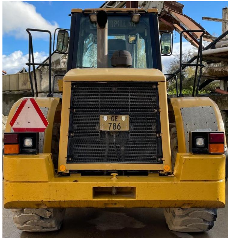
Photo VI Vue arrière et radiateur- Rückansicht und Kühler- Rear view and radiator