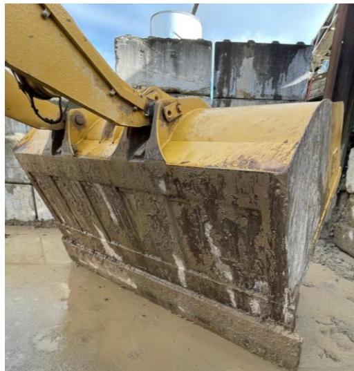
Photo V Détail godet-Bucket detail - Detail Becher