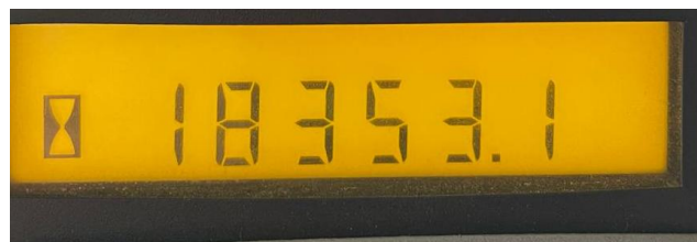
Photo XI Compteur heures 966 GII-966 GII hour meter - Stundenzähler 966 GII