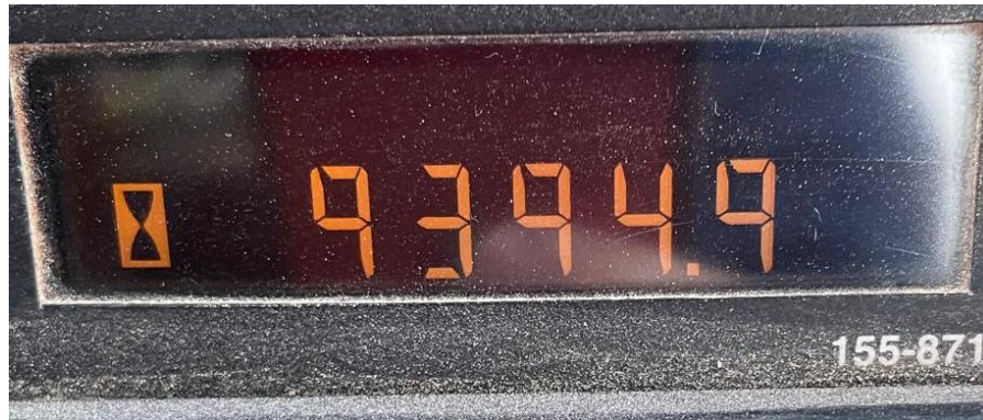
Photo XI Compteur heures 962 G-962 G hour meter - Stundenzähler 962 G