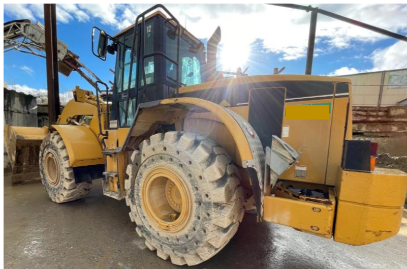
Photo III Vue état machine-pneus increvables- Ansicht Maschinenzustand – pannensichere Reifen- View machine status – puncture-proof tyres