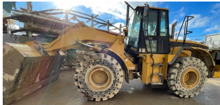
Photo II Autre vue-Another view-Andere Seitenansicht