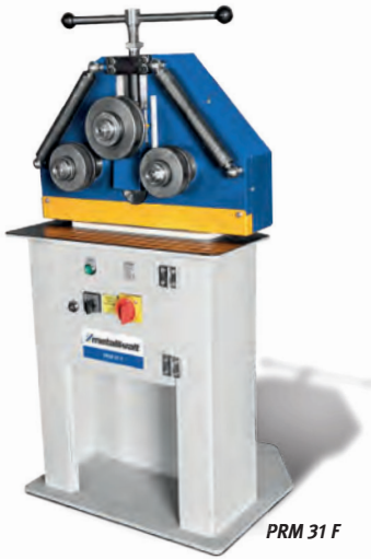
PRM 31 F