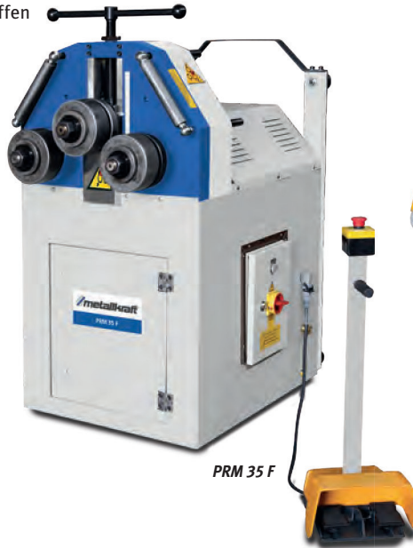
PRM 35 F