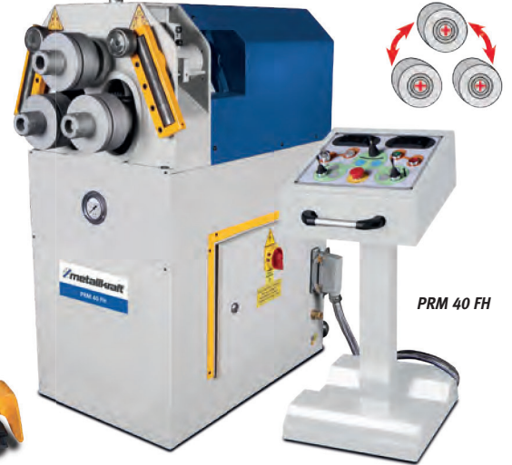
PRM 40 FH