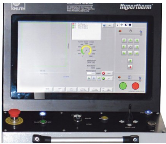
EDGE® Connect ist die neueste CNC-Plattform von Hypertherm und zeichnet sich durch unübertroffene Zuverlässigkeit, leistungsstarke integrierte Funktionalität und hohe Anpassbarkeit aus