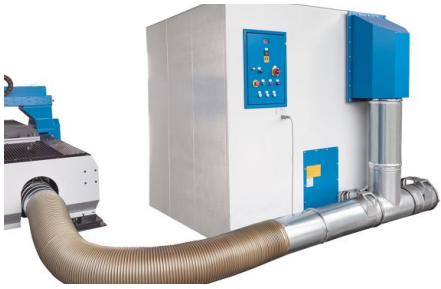
Staubabsaugung und Filteranlage als Option erhältlich