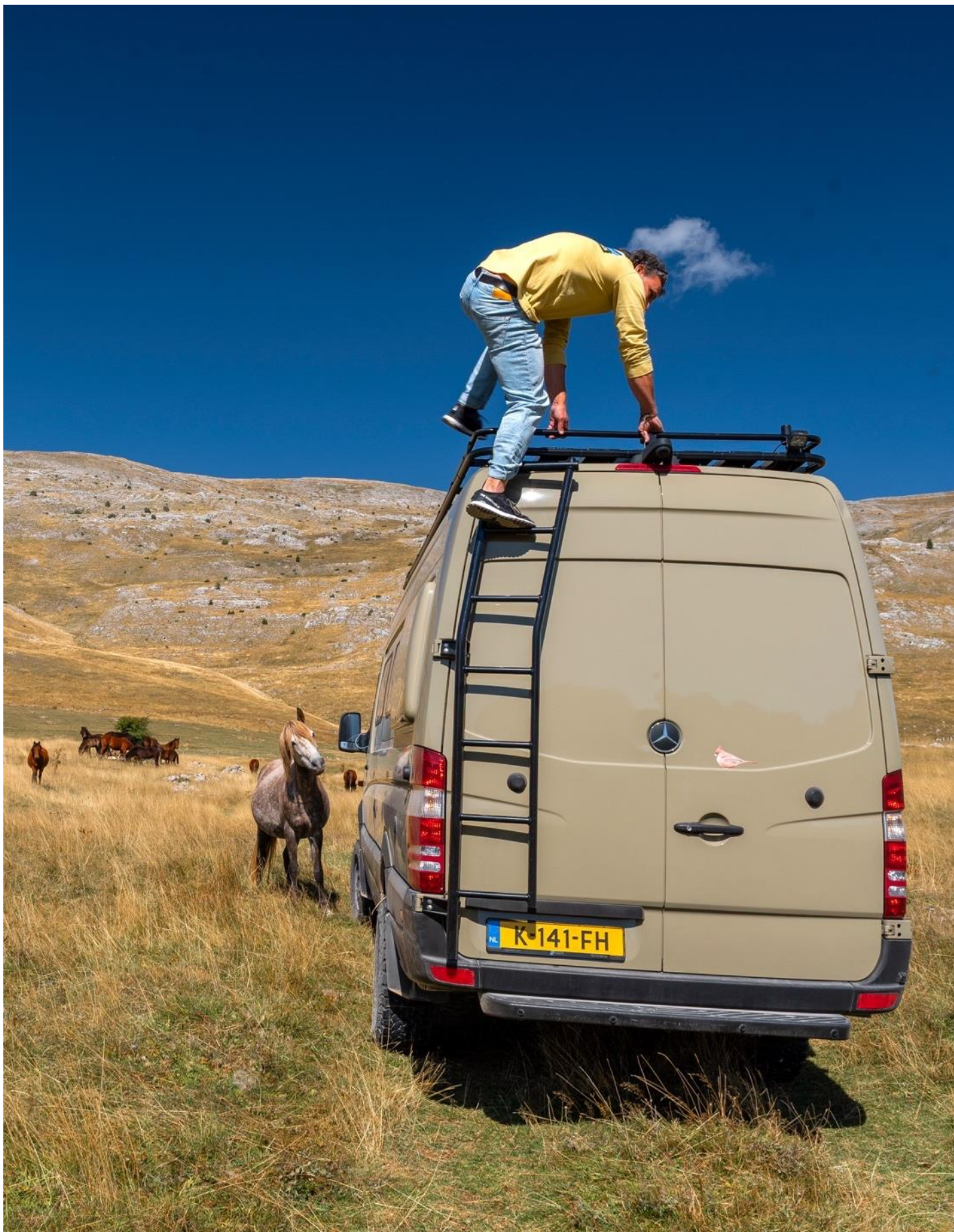
In Bosnië & Herzegovina op het Bjelasnica plateau op weg naar Lukomir.