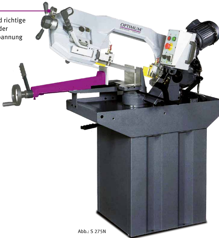
Abb.: S 275N