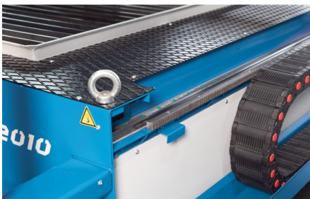
Die auf Dauerbetrieb ausgelegten Linearführungen und schrägverzahnten Zahnstangenantriebe sind verschleißarm und nahezu wartungsfrei