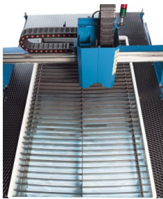
Die Maschine ist mit der Option mit der "Art.Nr. 253403 Wassertisch für Plasmaschneiden" ausgestattet