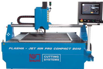
Die einteilige Bauweise mit Tischrahmen integrierten Führungen ermöglicht einen Transport der Anlage im montierten Zustand und garantiert eine schnelle und einfache Inbetriebnahme