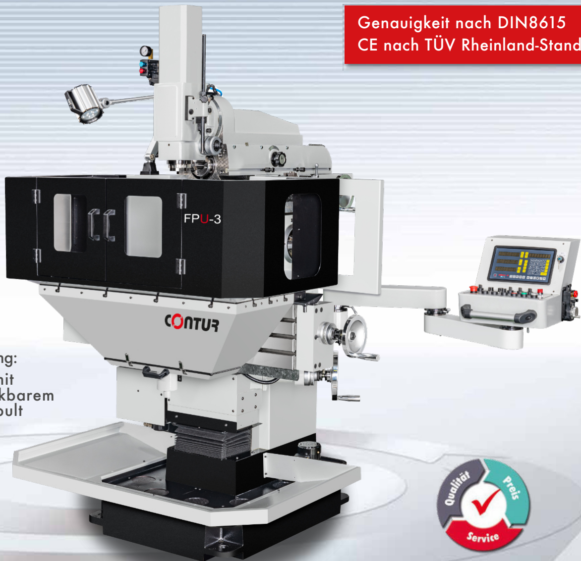
Abbildung: FPU-3 mit schwenkbarem Bedienpult

Genauigkeit nach DIN8615 CE nach TÜV Rheinland-Standard