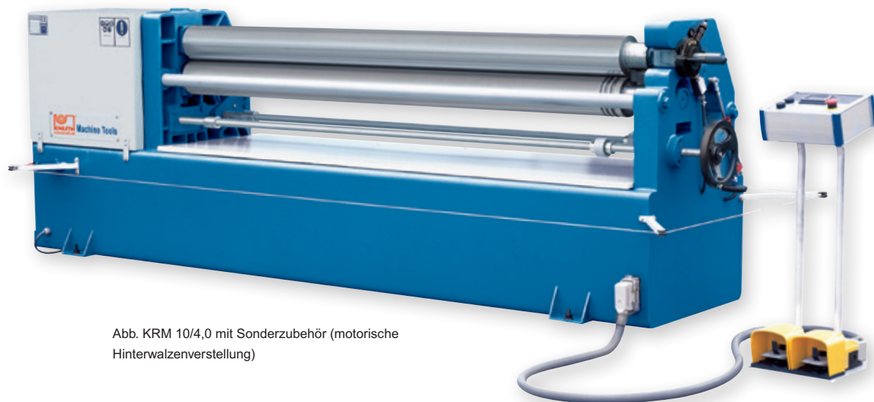
Abb. KRM 10/4,0 mit Sonderzubehör (motorische Hinterwalzenverstellung)