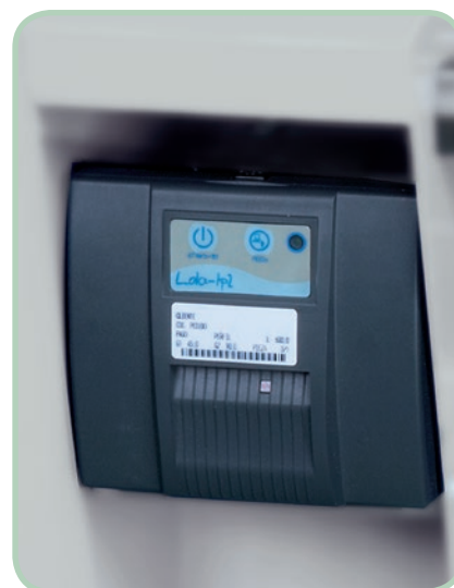
Etiquetadora opcional. Optional labeling machine.