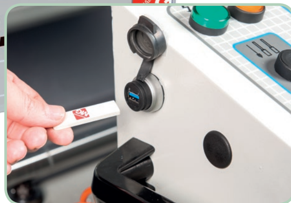
Entrada USB. (EXCEL, TXT, CSV) USB connection. (EXCEL, TXT, CSV)