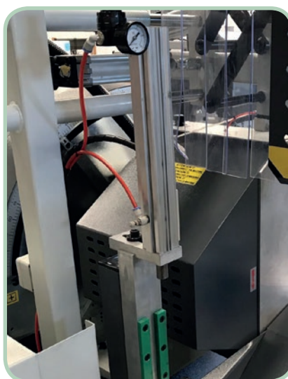
Calibre opcional. Optional caliber.