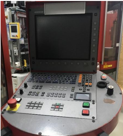
Steuerung (control unit)