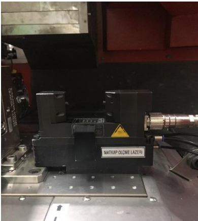
Messsystem (measurement system)