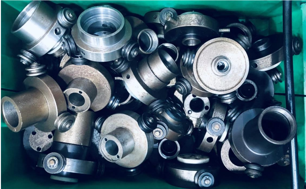
Mitnehmerpaket zu KFD-HsmB 250/3