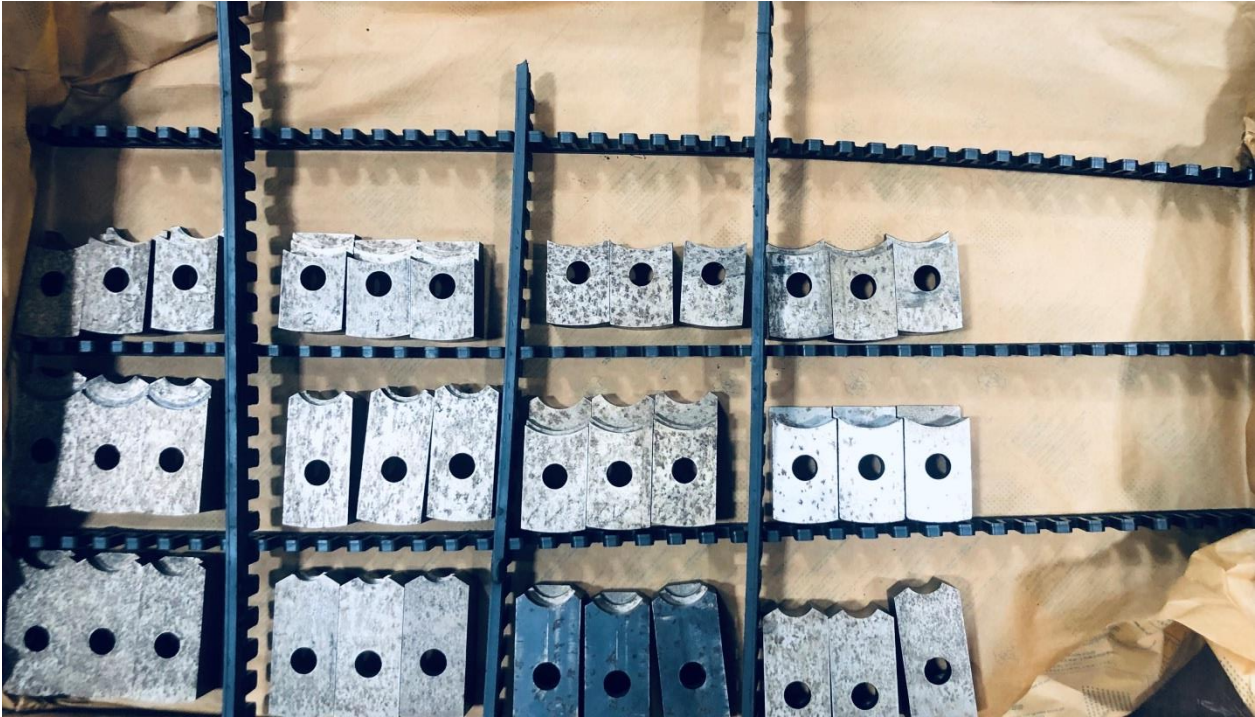
Weiche Backensätze zu KFD-HsmB 250/3