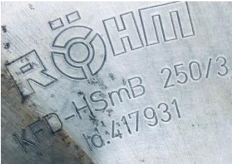
Kraftspanfutter KFD-HSmB 250/3