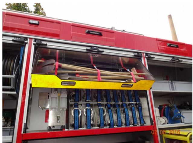
Kippbare Schubladen nach Ihrem Wunsch