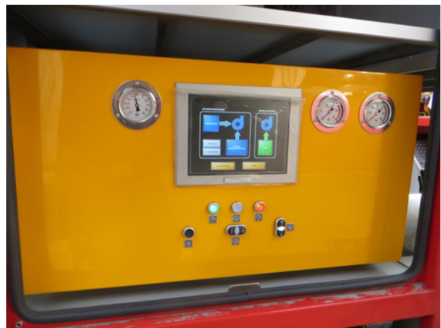
Pumpenbedienung nach Ihrem Wunsch