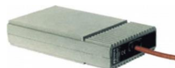
Preriscaldamento Engine preheating system