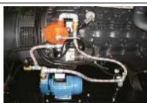
Kit travaso automatico carburante Automatic fuel transfer kit