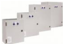
Quadro di commutazione automatica (ATS) da 90A 90A automatic transfer switch (ATS)