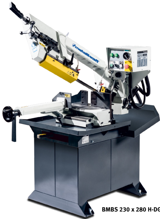
BMBS 230 x 280 H-DG

! Eine ausführliche Erklärung der Steuerungen finden Sie auf den Seiten 227 – 231