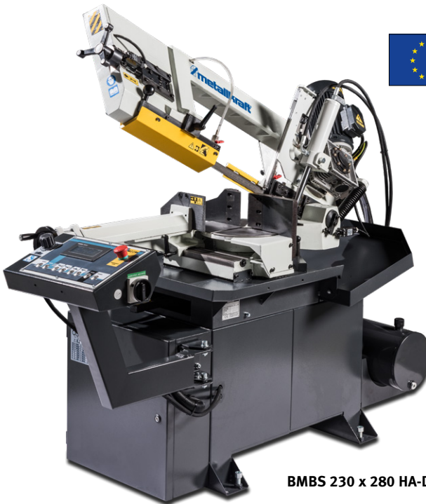
BMBS 230 x 280 HA-DG