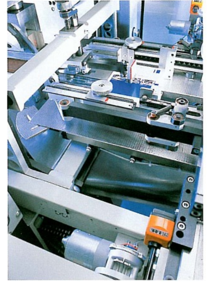
▷ Motorische Verstellung – Seiten-ausrichtung