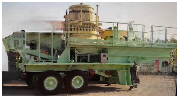
Photo I Groupe mobile SYMONS sur semi-remorque

Marquage CE Bronzes remplacés à neuf Révision en atelier avant sablage et peinture Pièces d'usure neuves Convoyeur extraction en parfait état 800 x 4.0 [m] Moteur électrique Coffret électrique Câblage