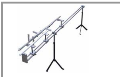
GL200AV-1,5 / GL200AV-3,0