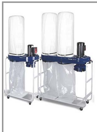
FSAB-2053 / FSAB-2553