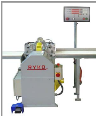
LA-620E / LA-730EFS