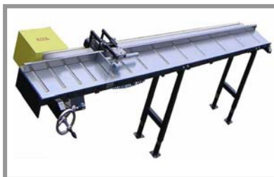
LDRR / LDRL