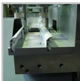
Mit einer Profilizulage All with one counter plate