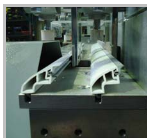
Arbeiten ohne Umrüsten Easy working flow