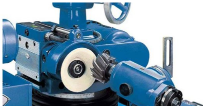
Stabile winkelbare Werkstückaufnahmen