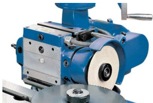
Schärfen eines Sägeblattes