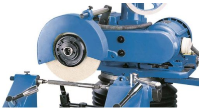
Schwenkbarer Spindelstock und umfangreiches Zubehör