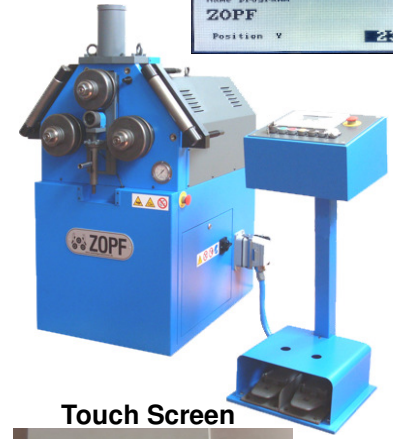
ZB70/3M ECO ZB70/3HA