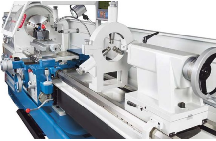
Lünetten zur präzisen Bearbeitung langer Werkstücke