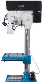
Große Ausladung und großer Arbeitstisch