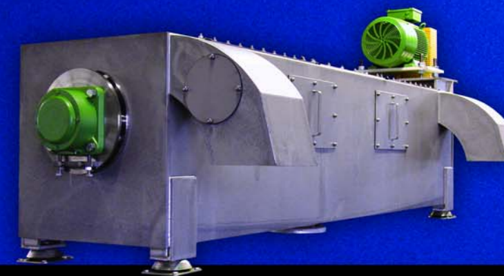
Friktionsabscheider FA 600/3200