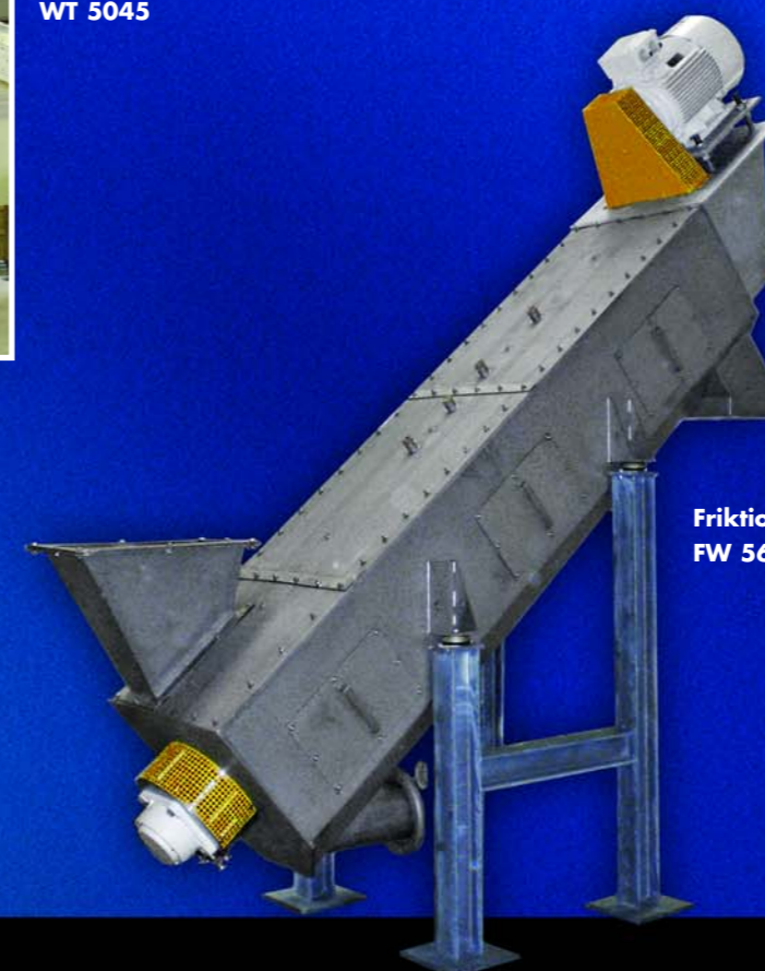
Friktionswäscher FW 560/3000

Um Beschädigungen an den nachfolgenden Zerkleinerungsaggregaten / Waschaggregaten zu vermeiden, werden in den Anlagenprozess Vorwaschaggregate, wie z.B. die Vorwaschtrommel der Baureihe WT der NEUE HERBOLD in die Anlage integriert. Durch den Einsatz der Vorwaschtrommel werden die geschredderten Folien von schweren Störstoffen wie z. B. Steinen, Reifenschnitzel, Metallen, etc.