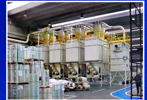
Foliensilos Baureihe FS