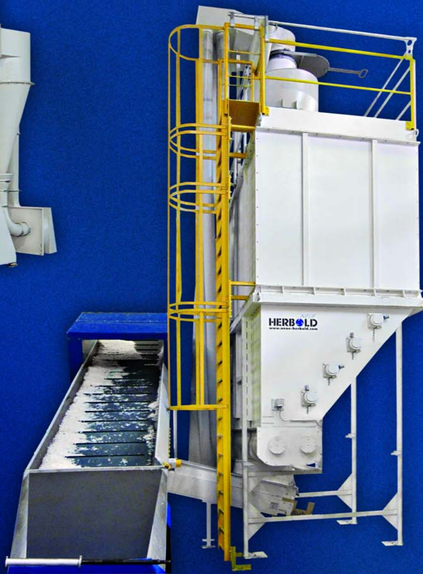
Foliensilo Baureihe FS