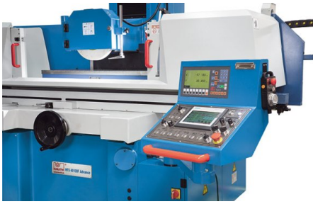
Alle notwendigen Parameter für die präzise Zustellung der Schleifspindel werden direkt am Siemens-Touchscreen erfasst und editiert