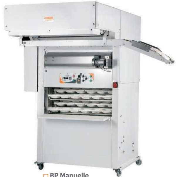
□ BP Manuelle