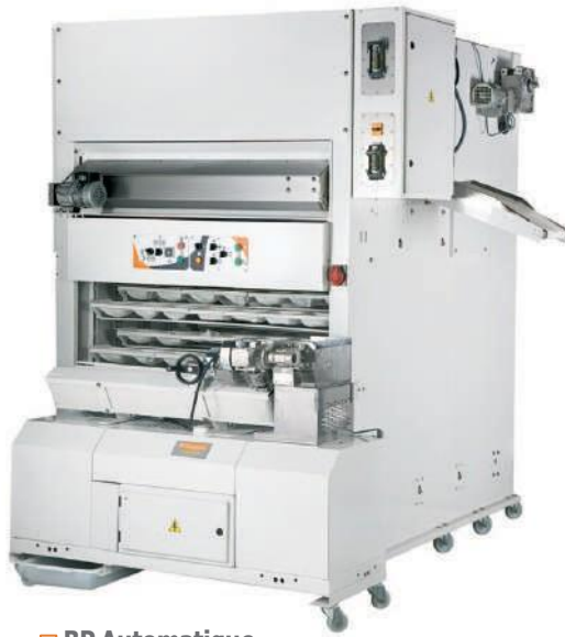
□ BP Automatique