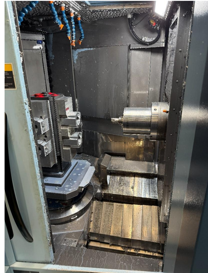
Innenraum nach links geschaut