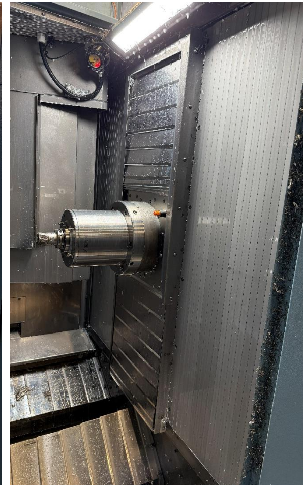
Innenraum nach rechts geschaut