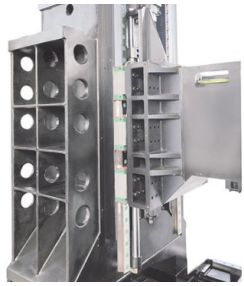
Gusskörper mit großer Spannweite