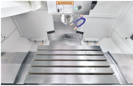
Massiver Maschinentisch mit 5 Nuten