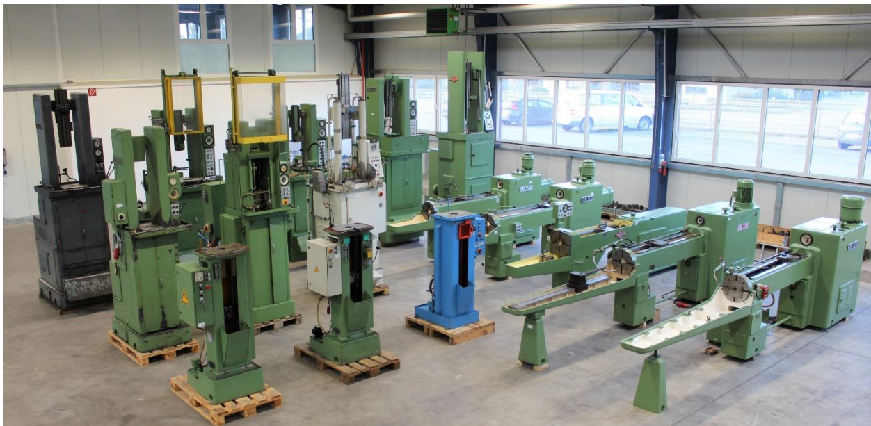
Bild aus unserem Gebrauchtmaschinen Lager, mit horizontalen und vertikalen Maschinen bis 16.000 kg Zugkraft

Wir sind vom Hause ein Lohnräumbetrieb und können Ihnen auch bei technischen Fragen aus 50-jähriger Erfahrung in der Räumtechnik behilflich sein.