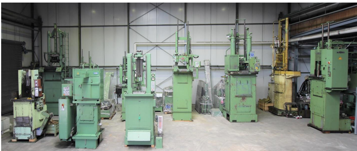
Bild aus unserem Gebrauchtmaschinen Lager, mit vertikalen Maschinen bis 63.000 kg Zugkraft