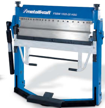
FSBM 1020-20 HSG

Mit segmentierten Scharfbiegewerkzeugen, segmentierter Biegeleiste und durchgehender Betauflage