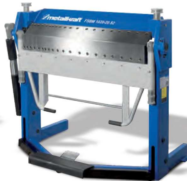
FSBM 1020-20 S2

Mit segmentierten Scharfbiegewerkzeugen, durchgehender Biegeleiste und durchgehender Betauflage