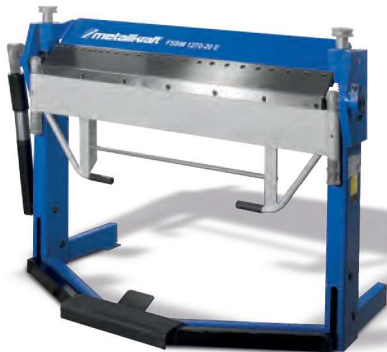
FSBM 1270-20 E

Mit segmentierten Scharfbiegewerkzeugen, durchgehender Biegeleiste und durchgehender Betauflage