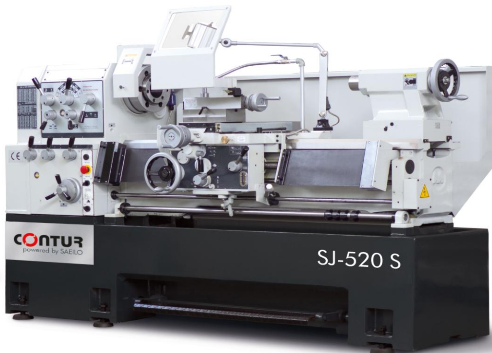
Abbildung: CONTUR SJ-520 / 1500S

Die Präzisions-Spitzendrehmaschine CONTUR SJ-520 ist eine robuste, hochwertige und bedienerfreundliche Universaldrehmaschine für Produktion und auch als Beistellmaschine bei wechselndem Bedienpersonal. Die Bedienung der Maschine ist sehr einfach und erfordert kein langwieriges Durchsuchen von Tabellen bei Einstellungen von Spindeldrehzahl oder Vorschüben.