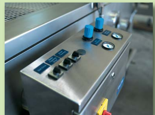
Bedienkonsole mit übersichtlich angeordneten Steuerungselementen