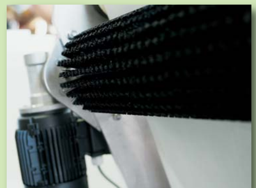
Angetriebene Walzenbürste zur Bandreinigung (optional)