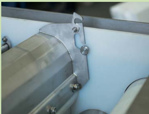
Leicht entnehmbare Maische-Leitbleche