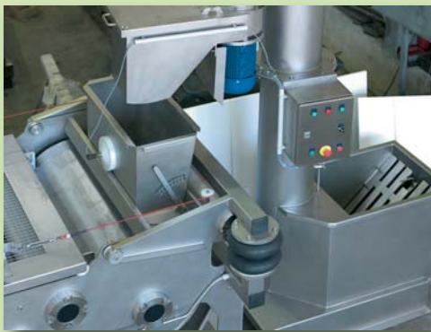
Großzügig dimensionierter Einfülltrichter mit Füllstandsüberwachung

Die so hergestellte Maische wird direkt auf das Pressband aufgetragen. Eine automatische Schaltung verhindert ein Überfüllen des Dosierbehälters. Steinobst wie Kirschen, Pflaumen, Aprikosen oder Pfirsiche müssen vor dem Pressen in einer Entsteinmaschine (Kreuzmayr KEP 650, KEP 1000 oder KEP 1500) vom Kern befreit werden, um einen reintönigen Saft ohne Kernanteile herstellen zu können.