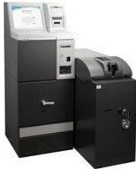
Abb. inkl. Option Banknotenrecycling