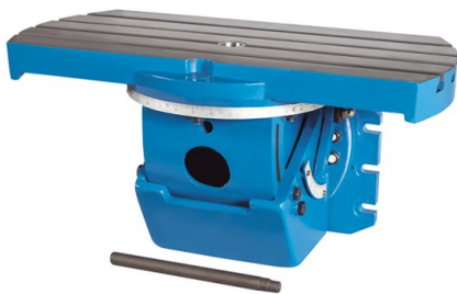
Universalschwenktisch für FPK 4.3 / FPK 6.3 (253721)