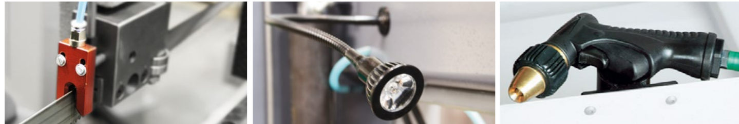
Die Micro-Sprüh-Einrichtung sorgt für einen dünnen Schmierfilm direkt an den Zahnschneiden als Alternative zur standardmäßigen Emulsionskühlung.