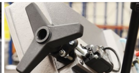
Die Sägebandspannung ist mit einer Sägebandspannungs- und Sägebandbruchüberwachung ausgestattet