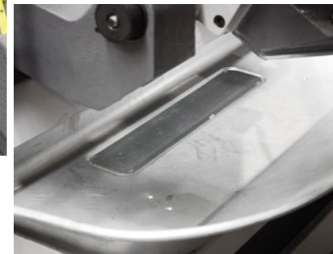
Die große Spänewanne sorgt für eine einfache Entsorgung der Späne und für ein trockenes Umfeld der Säge