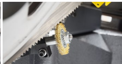
Die synchron zur Sägebandgeschwindigkeit angetriebene Spänebürste sorgt stets für freie Spannkammern