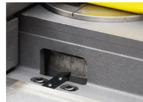
Die groß dimensionierte Gehrungsskala ist gut sichtbar direkt an der Bedienseite mit einem Zeiger platziert