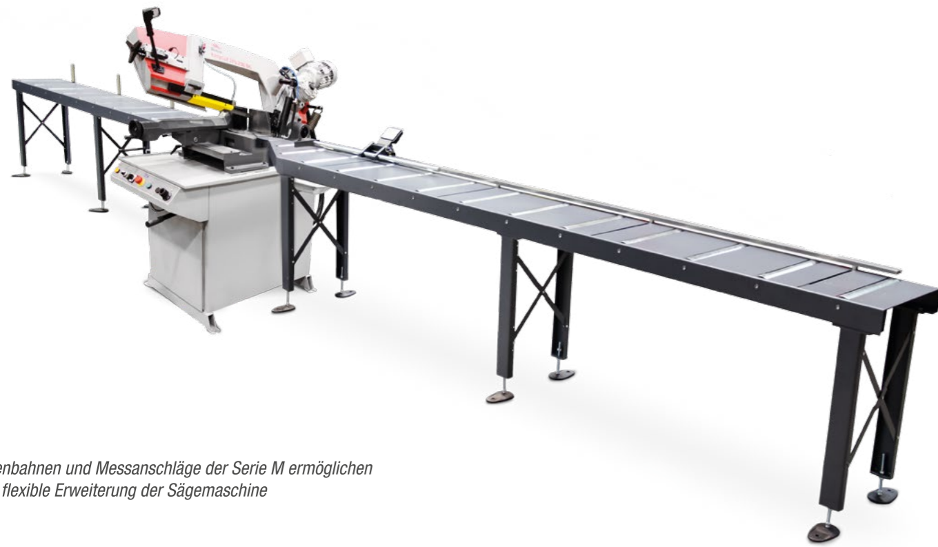
Rollenbahnen und Messanschlüge der Serie M ermöglichen eine flexible Erweiterung der Sägemaschine