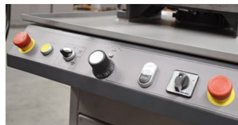
Sämtliche Bedienelemente sind von der Vorderseite der Maschine aus zugänglich