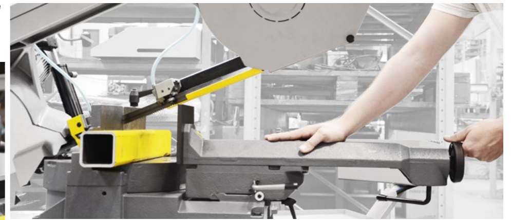
Die Schnellverstellung ermöglicht das Zustellen des Spannstockes innerhalb von Sekunden für den gesamten Spannbereich