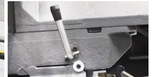
Die Schnellspanneinrichtung für Serienschritte öffnet nur einige Millimeter um das Material vorzuschieben