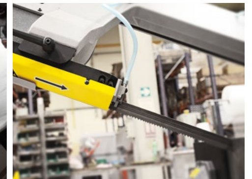
Dank dem einstellbaren Führungsarm, kann die Sägebandführung stets möglichst nahe zum Material gestellt werden