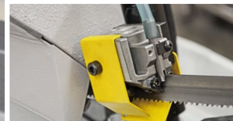
Das Sägeband wird mittels geschliffenen Hartmetallplatten präzise geführt