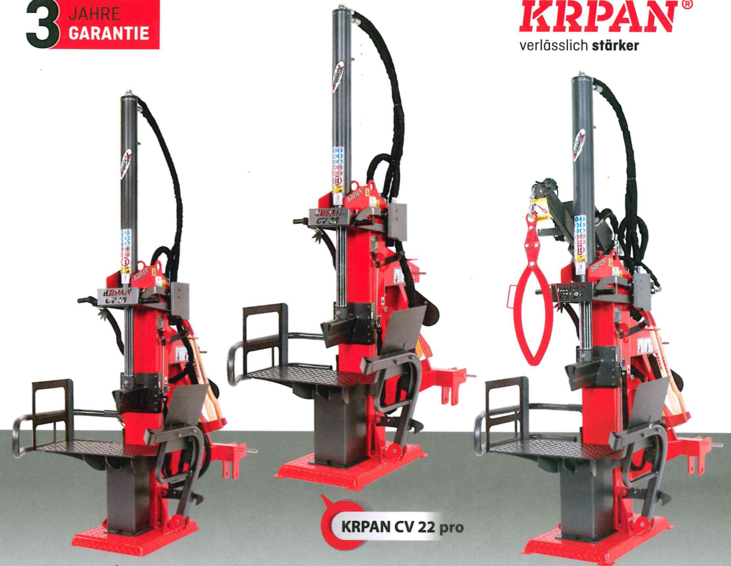
KR PAN CV 18 pro